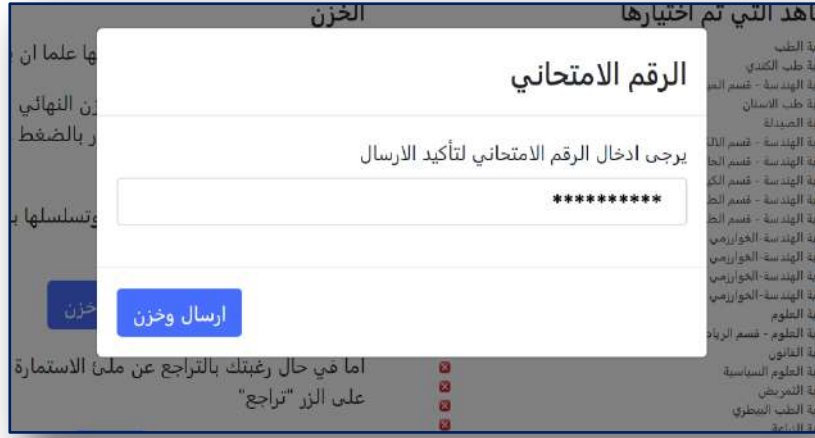
الشكل رقم (١٣) إدخال الرقم الإمتحاني لتأكيد الإرسال

وبعد كتابة الرقم الإمتحاني لتأكيد الإرسال والضغط على الزر (إرسال وخرن) سيتم إرسال خيارائك وخرنها ويتم اعتماد الإستمارة بشكل نهائي . في حال نجاح الخزن ستظهر لك الرسالة الموضحة في الشكل (١٤) لتمكنك من سحب الوصل (إستمارة التقديم الإلكتروني) الخاص بك والمثبت فيه إختيارائك المخزونة.