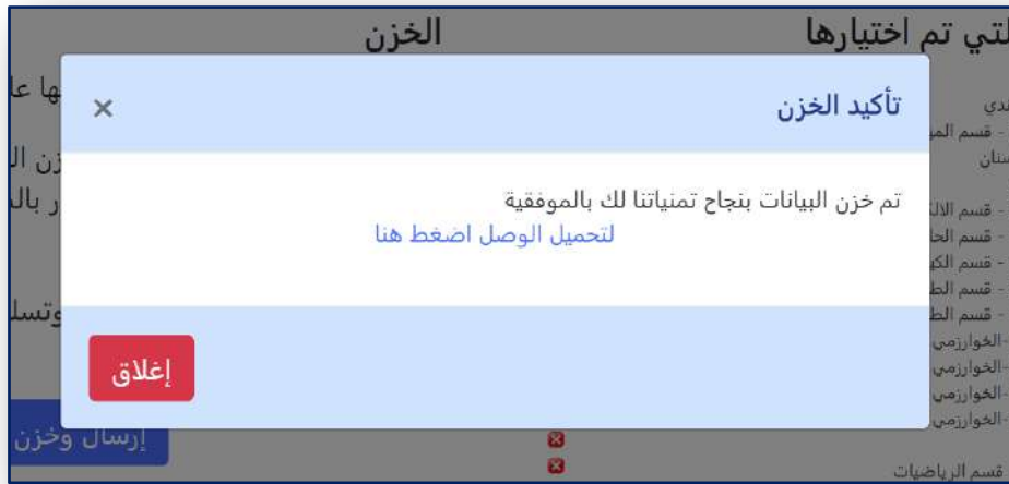
الشكل رقم (١٤) تحميل إستمارة التقديم الإلكتروني

وبعد كتابة الرقم الإمتحاني لتأكيد الإرسال والضغط على الزر (إرسال وخرن) سيتم إرسال خيارائك وخرنها ويتم اعتماد الإستمارة بشكل نهائي . في حال نجاح الخزن ستظهر لك الرسالة الموضحة في الشكل (١٤) لتمكنك من سحب الوصل (إستمارة التقديم الإلكتروني) الخاص بك والمثبت فيه إختيارائك المخزونة.